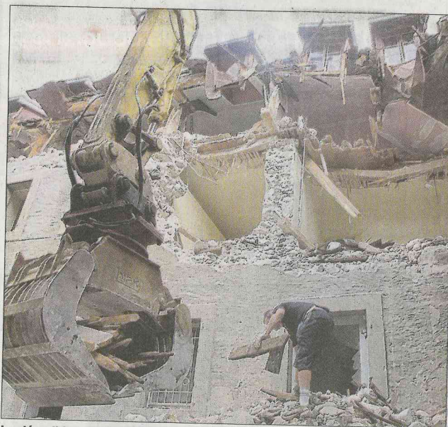
La démolition a débuté vendredi.

Les travaux ont débuté la semaine dernière. La seule démolition des bâtiments va générer pas moins de 1 500 à 2 000 m 3 de gravats, qui seront compactés et réutilisés in situ pour créer les plateformes des terrains. Trois des cinq terrains prévus sont déjà en cours de réalisation. Le décapage (6 000 m 3 de terre) réalisé, le terrassier