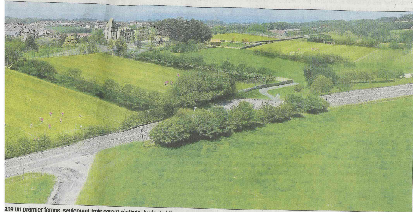
ans un premier temps, seulement trois seront réalisés, budget oblige. Document DR

in- era les oir, ca- ... re- les (€) Au on nt u- Le la es on el- il-