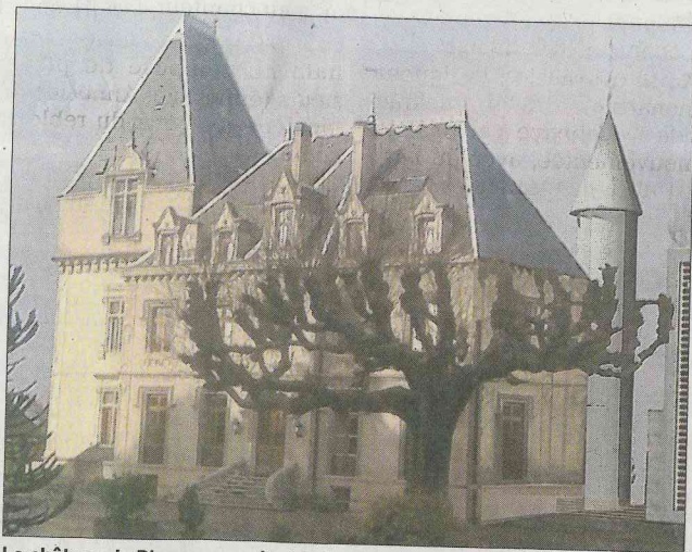
Le château de Blonay sera réhabilité et sa tourelle mise en valeur. Document DR

in- era les oir, ca- ... re- les (€) Au on nt u- Le la es on el- il-